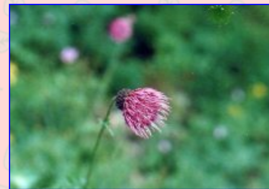
8月18日(土) 12時18分 白馬大池から白馬岳へ ただいま三国境で休息中。 茨城県新治郡桜村吾妻 山元昭二