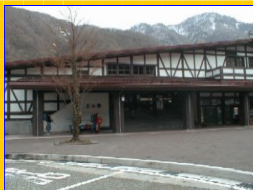
立山駅から、美女平駅

4・14 今日4/20の室堂までのオープンの前に一部開通ということで、弥陀ヶ原まで行ってきました。 天気もよいと思っていたのですが、朝になるとやや期待はずれで、下り坂のようです。 さっそく、朝「立山駅」まで行ったが、始発はなんと8時、美女平初は9時、しかも1日3便。 ちょっと、不安ととまどいが急に襲ってきた。なにしろ行ったのが6時なのだから・・・ しかし、気を取り直して、とりあえず計画通り行くことにした。 スキーの荷物が多くなりそうなので、天気もあいまいなので、今日はデジタルカメラで撮影することにした。